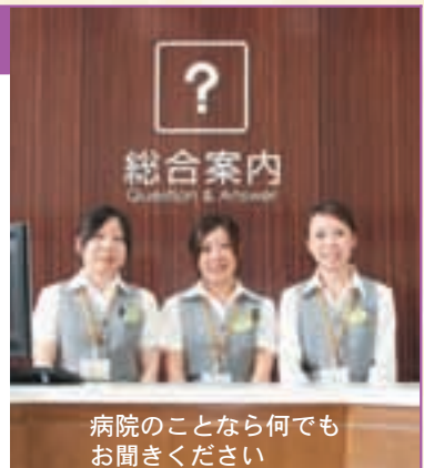
病院のことなら何でもお聞きください

1階ロビー入口付近には総合案内があります。分からないことがありましたら、お気軽にお声をください。