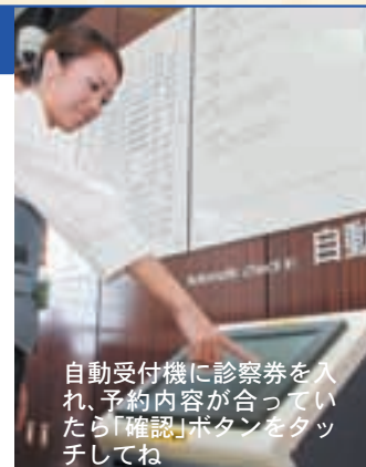
自動受付機に診察券を入れ、予約内容が合っていたら「確認」ボタンをタッチしてね

診察が初めての方の受付は「新患受付」へ、紹介状をお持ちの方は「地域医療連携室」で受付してください。再診の方(要予約)は「自動受付機」で受付をします。タッチ式の受付機で、使い方はとっても簡単!分からない場合は、近くのスタッフにお訪ねください。