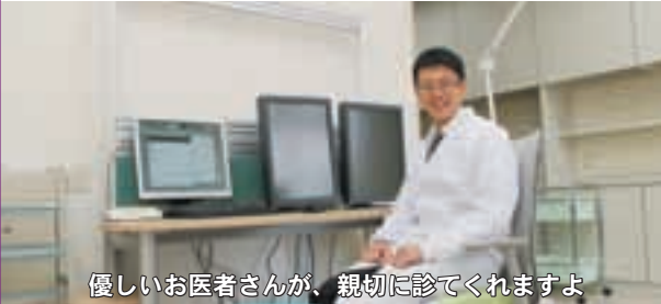
優しいお医者さんが、親切に診てくれますよ

新病院での診察は、電子カルテや完全予約制の導入などのほか、診察室の配置も工夫して効率の良い医療サービスを提供できるようになっています。