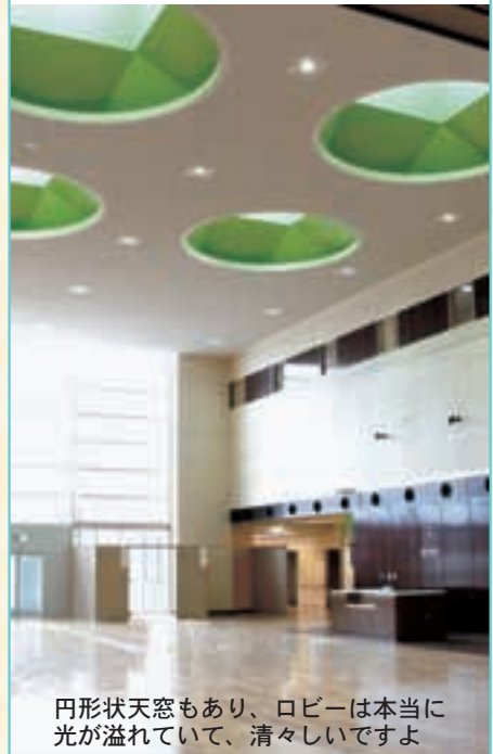
円形状天窗もあり、ロビーは本当に光が溢れていて、清々しいですよ

正面玄関がある南側は一面ガラス張り。太陽の日差しがさんさんと差し込む、明るいロビーへと繋がっています。