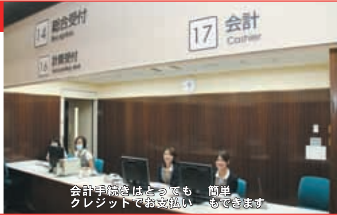
会計手続きはとっても簡単 クレジットでお支払いもできます

全ての医療行為が終わったら、「計算受付」にファイルを提出してください。その後、診察券・処方せん・予約指示票などを受け取り、会計窓口右側にある会計待ち表示板に受付番号が表示されたら、自動精算機で会計を済ませましょう。カード挿入口に診察券を入れるだけで、その日の診察金額が表示されますので、とっても簡単です。