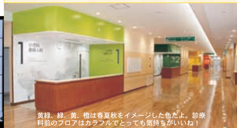
黄緑、緑、黄、橙は春夏秋冬をイメージした色だよ。診療科前のフロアはカラフルでとっても気持ちがいいね!